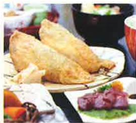
阿蘇市一の宮町宮地 3093 ☎ 0967-22-0896 http://www.aso-hanabishi.com

阿蘇はなびし お食事処 阿蘇の大自然の恵みから生まれた素材と阿蘇人(あそんもん)の手により、お客様に「阿蘇」を味わっていただけるよう真心こめた食材ばかり。 中でも地域特有の朝晩の気温差と湧水で育ったあそのお米を使った「田舎いなり」が有名で、お土産としても大人気。 阿蘇ならではの、愛情こもった郷土料理を是非ご堪能ください。