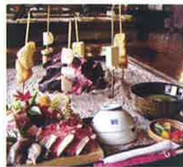
阿蘇市湯浦 718-1 ☎ 0967-24-6707 http://www.asonoyamahoushi.com

阿蘇はなびし お食事処 阿蘇の大自然の恵みから生まれた素材と阿蘇人(あそんもん)の手により、お客様に「阿蘇」を味わっていただけるよう真心こめた食材ばかり。 中でも地域特有の朝晩の気温差と湧水で育ったあそのお米を使った「田舎いなり」が有名で、お土産としても大人気。 阿蘇ならではの、愛情こもった郷土料理を是非ご堪能ください。