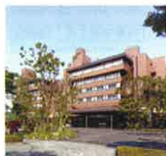
阿蘇市内牧1287 ☎ 0967-32-0711 http://www.asoplaza.co.jp

阿蘇乃やまぼうし 大自然に囲まれたゆつたりとしたロケーション。昔ながらの趣を大切にしたりは、どこか懐かしく、新鮮な空間。 みんなで囲んで食べる囲炉裏での田楽や赤牛ステーキは、大自然阿蘇の名物料理です。 遠方からお越しの方々に、他では味わえない空間と料理に大満足していただいております。