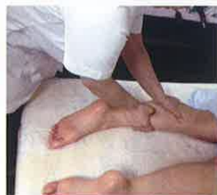
熊本県阿蘇市内牧 252-9 ☎ 0967-32-0198

一角堂整体院 旅の疲れ、日頃の疲労を和らげてくれる内牧温泉の癒し処。しっかりした知識とていねいな対応が人気。 出張対応も可能ですので、是非お問い合わせください。