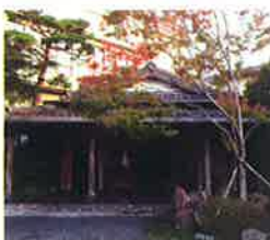
阿蘇市内牧 145 ☎ 0967-32-0515 http://www.sozankyo.jp

阿蘇プラザホテル 客室の窓から阿蘇五岳を一望できる大パノラマと館内での湯巡りができる広々とした温泉施設も充実。 災害から三ヶ月半。十一月一日より、リニューアルオープン。第二創業を果たした新生プラザホテルの今後には是非ご期待下さい。